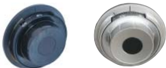
Elektroniska och mekaniska kodlås med en mängd olika funktioner.