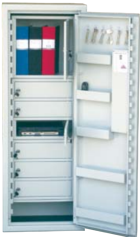
SP88 med låsbara fack

Säkerhetsskåp certifierat enligt SS-3492